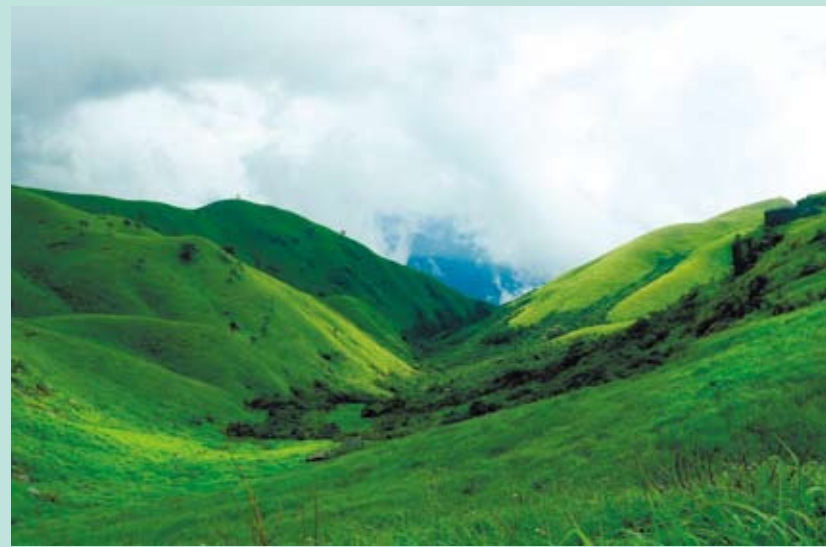
江西武功山。

學多識，天曆元年(1328)遷被遷升為專轄宮廷金石書畫鑒定的鑒書博士。他特別擅長畫墨竹，作品流傳至今的有《竹石圖》、《雙竹圖》等，並著有《竹譜》一書。彷彿仙居公孟這片滿山的蔥翠，從那個年代始便一直暈染至今，否則柯九思晚年就不會如此戀戀不忘故鄉的一花一草，他以「山不入目不能畫，水未入懷不能吟」為婉拒了他人賜畫之求，然其作品的靈感來自其實早就鋪展於所有遊客面前。