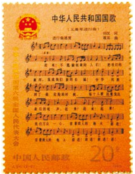
第六屆全國人民代表大會紀念郵票 J.94(2-2)/1983

而M牢實的坐上二戰後日寇敗走的辦公桌，我兩度被輕言慫恿進入投票所○○，○○的雙眼迷惑，我還是清醒的走出投票所，走出二戰後延命的後殖民霸權勒索，聽命於某宗主國一再逼我投票、投票，投完票後不厭足一再將我戲弄。