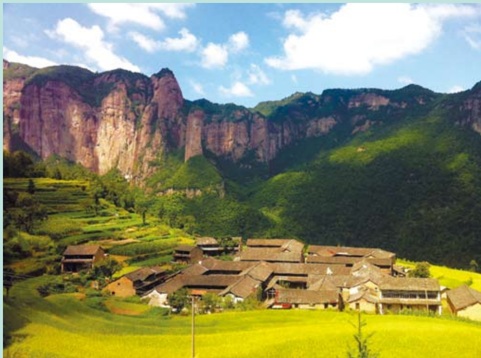
浙江仙居公孟。