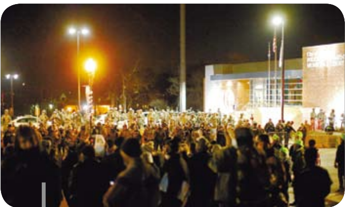
美國密蘇里州佛格森，人們走上街頭繼續進行抗議，表達對陪審團決定的不滿。圖為員警與示威者在佛格森警局前對峙。