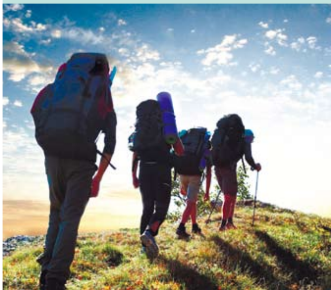
大陸近年來有越來越多人開始選擇徒步旅行，這種運動方式既是時尚也是一種挑戰。

最能瞭解人文風俗的旅行方式。徒步，是依靠雙腳和簡單工具的一種運動，大自然中的各種外部條件可能隨時都會給徒步旅行帶來困難，天氣的變化、自然環境的不同等等。除此之外，徒步者還會遇到體力、毅力和智慧的挑戰。