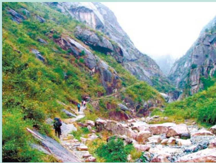
徽杭古道。